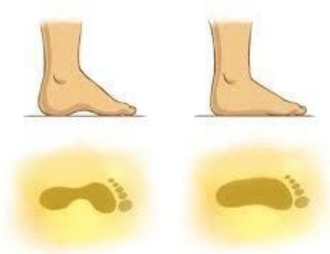
Rysunek 1 Po lewej stopa prawidłowa, po prawej stopa płaska

Prawidłowo ukształtowana stopa nie dotyka podłoża w całości, a opiera się o nie trzema punktami. Dzięki odpowiedniej pracy mięśni i więzadeł, jej kości przyjmują postać łuku, co zapewnia utrzymanie prawidłowej elastyczności podczas chodu. Płaskostopie natomiast ma miejsce wtedy, gdy sklepienia stopy się obniżają powodując, że staje się płaska.