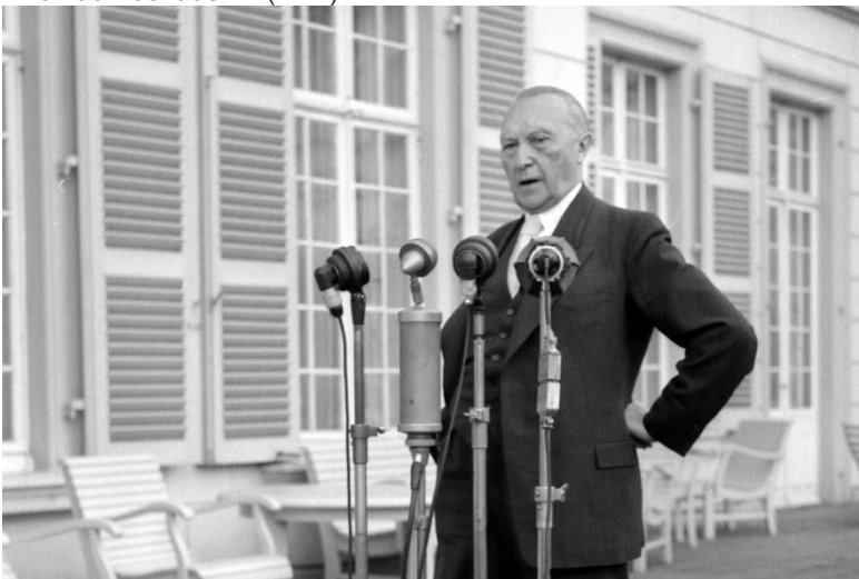
- Robert Schuman (Francja)