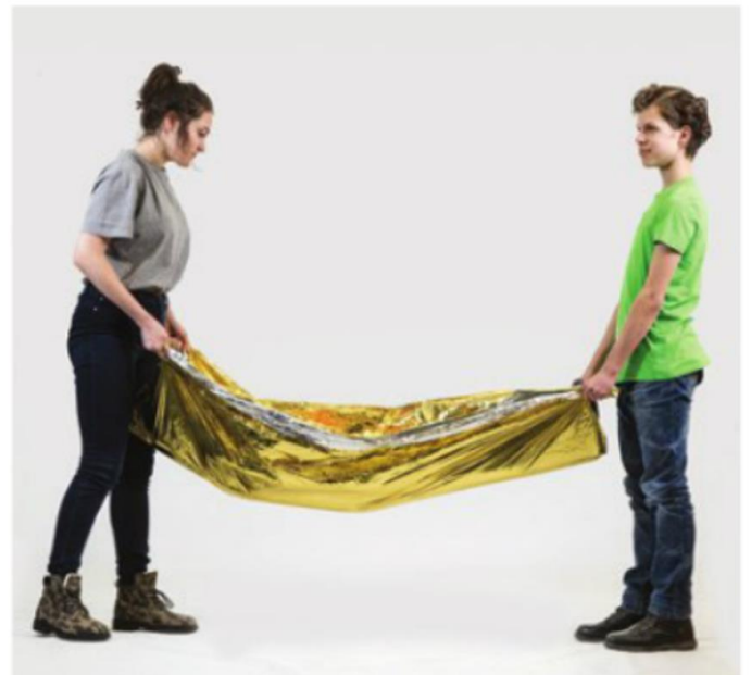
▲ Transport poszkodowanego w kocu termicznym