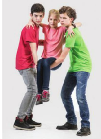
▲ Przenoszenie „na ławeczce”