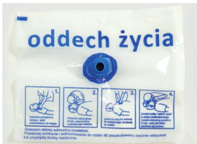
▲ Jednorazowa maska do sztucznego oddychania