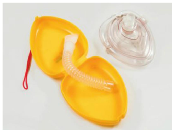
▲ Kieszonkowa maska do sztucznego oddychania w twardej pudełku