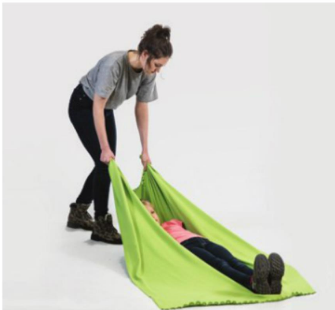
▲ Transport poszkodowanego na kocu