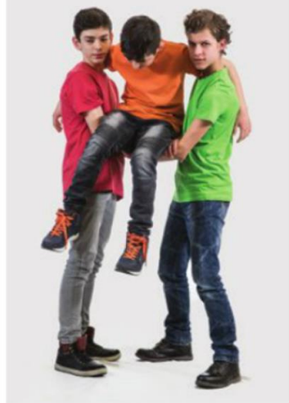
▲ Przenoszenie „na krzesetku”