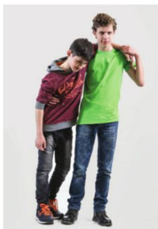
▲ Prowadzenie lekko poszkodowanego